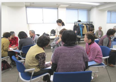
グループ別 ロールプレイング