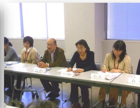
講師のアドバイス

NPO法人 かわさき創造プロジェクト 紹介 http://kawasaki-sozo.net